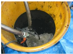
ロール内部薬品洗浄①