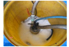
ロール内部薬品洗浄②