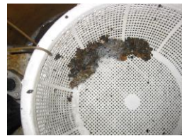
ロール内部水洗浄