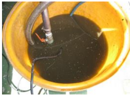
ロール内部水洗浄