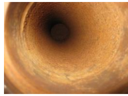
作業前軸内部状況②