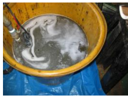
ロール内部中和洗浄