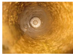
洗浄完了後軸内部②