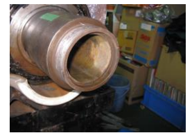
洗浄完了後軸外観