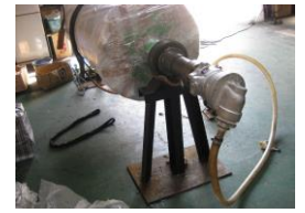
ロール洗浄器具装着