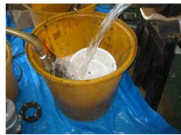
ロール内部水洗浄