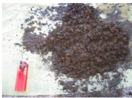
ロール内部水洗浄痕