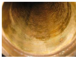
洗浄完了後軸内部①