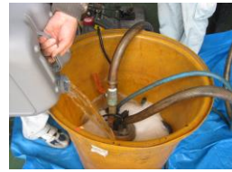
ロール内部薬品洗浄①