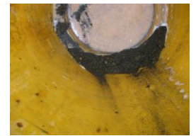
ロール内部水洗浄痕