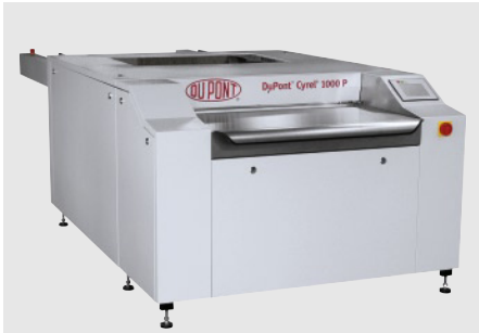
DuPont™ Cyrel® 1000 P